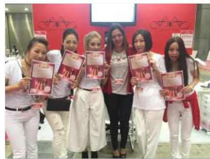
経験を積んでいただければ 1ランク上のマスターエデュケーターに 進むことも可能！