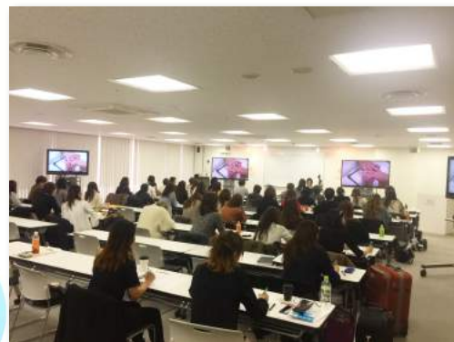
技術は進歩します。色々な 特別セミナーを開催します。