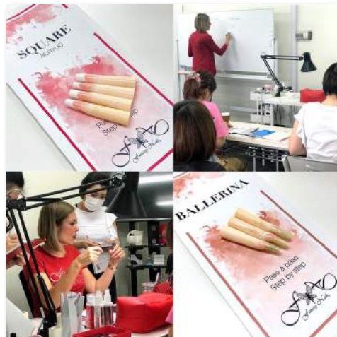
世界基準の理論は驚きの連続