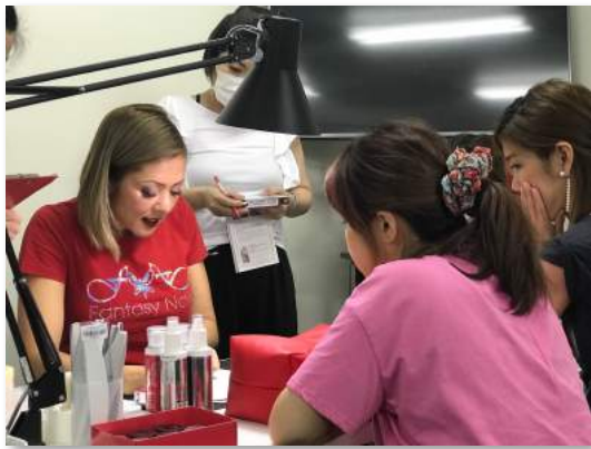
世界トップクラスの Michi先生から直接学べます