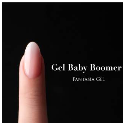
ジェルで作るベビーブーマー を御社でセミナー開催ができます