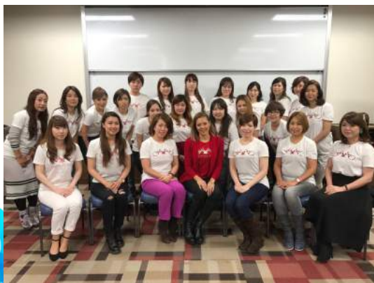
第1期ジェルナショナルエデュケーター 全国で活躍するエデュケーターの方々