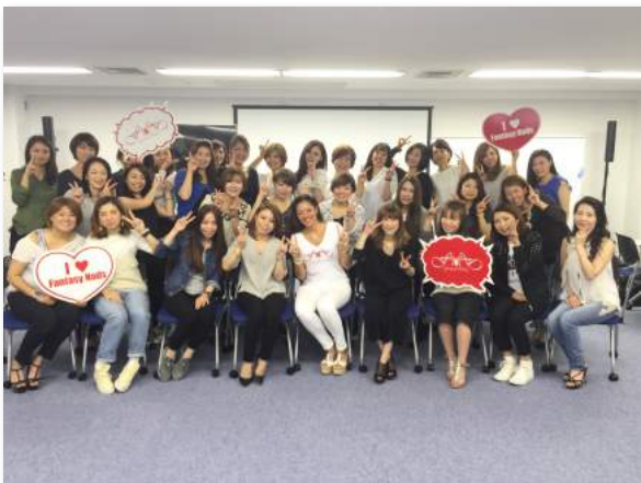
全国各地より集結！！