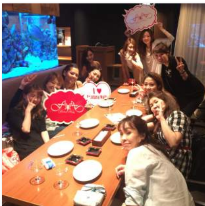
新たな仲間が誕生します