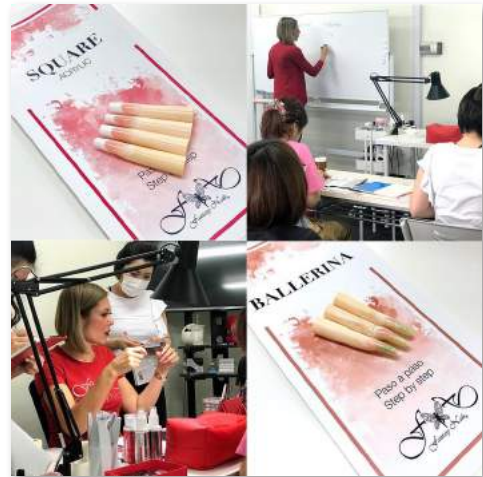
世界基準の理論は驚きの連続